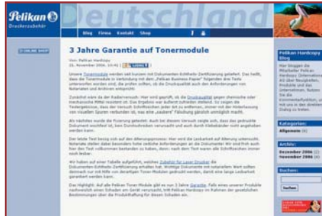
http://blog.pelikan-hardcopy.de – Unternehmens-Blog der Pelikan Hardcopy Deutschland GmbH

Die Vorteile sind vielfältiger Natur. Von Unternehmen geführte Blogs dienen in erster Linie der Verbesserung des Kundendialogs. Firmen sind für ihre Kunden auf einer persönlicheren Ebene ansprechbar, als dies beispielsweise auf einer regulären Website der Fall ist. Das kann in Form eines Textes geschehen, aber auch die Veröffentlichung attraktiver Bild- und Videomaterialien aus dem Unternehmensumfeld gestaltet sich im Vergleich zu herkömmlichen Websites äußerst einfach. Die direkte Ansprache eröffnet den bloggenden Unternehmen neue Chancen. Der Kunde lässt sich beispielsweise in die Produktentwicklung einbeziehen, Dienstleistungen können verbessert werden – das Feedback erfolgt unmittel-