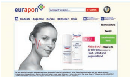
Website der Versandapotheke eurapon ( www.eurapon.de )

Zum Projektstart haben wir zunächst eine umfassende Keyword-Analyse durchgeführt, um die Chancen nachfolgender AdWords-Kampagnen möglichst präzise abzuwägen und den gesetzten Budgetrahmen optimal nutzen zu können. Hierbei galt es, eine ganzheitliche Strategie zu entwickeln, bei der die eingesetzten Werbekosten u. a. durch ein adäquates Keyword-Clustering und den gezielten Aufbau der AdWords-Kampagnen zu einer deutlichen und messbaren Konversionssteigerung führen. Eine weitere elementare Aufgabe bestand im Vorfeld der eigentlichen Projektarbeit darin, sich mit den für den Pharma-Bereich vergleichsweise strengen Werberichtlinien von Google vertraut zu machen.