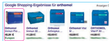
Ein Beispiel für die Einblendung von Google Shopping-Suchergebnissen

Während wir zum einen natürlich von Beginn an auf bewährte SEA-Maßnahmen setzten, nutzten wir zum anderen auch die erweiterten AdWords-Produkte wie Google Shopping. Mit Erfolg! Derzeit fließt daher circa ein Viertel des gesetzten Budgets in die Google Shopping-Anzeigen. Ebenfalls sehr erfolgreich funktioniert die Nutzung von Display-Anzeigen, Dynamic Search Ads und Remarketing.