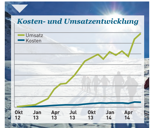
Erfreulich: Seit unserer Zusammenarbeit steigen die Umsätze weit stärker als die Kosten

Im weiteren Verlauf der Betreuung wird es darum gehen, neue wirkungsvolle AdWords-Kampagnen zu starten, bewährte Maßnahmen auch weiterhin zu optimieren und neue konversionssteigernde Potenziale zu erschließen. Die Möglichkeiten