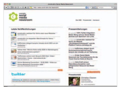
Beispiele: newsroom.konstruktiv.de , newsroom.tvister.de , travelcharme-newsroom.com

konstruktiv stellt den Social Media Newsroom vor: ein Social Media Newsroom (SMN) aggregiert die verschiedenen Presse-, Web 2.0 und Social Media-Aktivitäten eines Unternehmens und stellt diese übersichtlich in einer einheitlichen Oberfläche dar. Der SMN bietet interessierten Website-Besuchern, Kunden und Journalisten damit zentral alle aktuellen und interessanten Unternehmens-Inhalte aus verschiedenen Quellen. Positive Effekte hat ein solcher Newsroom zudem auch auf die Suchmaschinenpräsenz und Online Reputation Ihres Unternehmens.